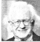
Fører tofjorntskog mot fundamenta-lismen.

Fredsforsker Johan Galtung mottok torsdag sitt åttende æresdoktorat, melder Klassekampen. Åttende kan muligens være en trykkfeil for åttende, men uansett dreier det seg denne gang om et doktorat ved universitetet i Alicante i Spania. Galtung benytter anledningen til å slå fast, en gang for alle, at USAs president George W. Bush er en like god fundamentalist som Osama bin Laden. — Det to kunne bytt manus utan at mange merkte seg skilnad. Viss det finst ulikskepar mellom Bush og bin Laden er det vel heller at bin Laden er djupare i sine analysar enn den amerikanske presidenten, sier den hederskronede nordmann som liksom aldri blir profet i eget land.