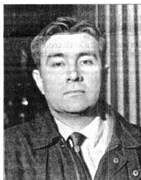
«Han har skrevet stygt om den eksklusive flokken jurister som har hatt med Riis-saken å gjøre.»